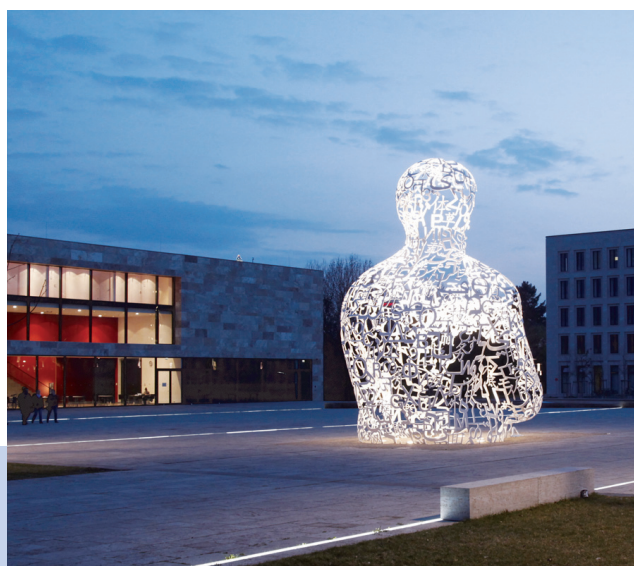
Der Alumni-Ball auf dem Campus Westend ist der sommerliche Höhepunkt der Goethe-Universität!