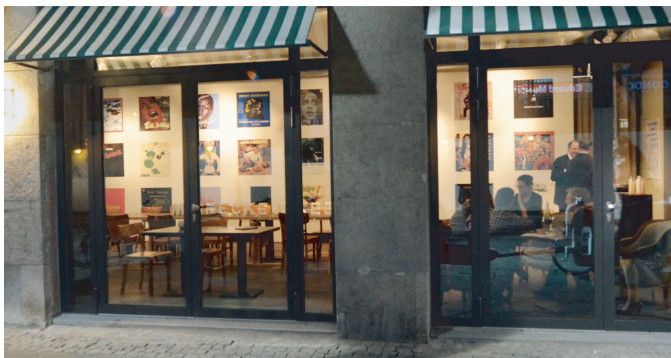
Reinschauen erwünscht: das ‚Haus des Buches‘ in der Braubachstraße 18-22.

Das ‚Fenster zur Stadt‘ ist ein Ausstellungs- und Veranstaltungsraum, der sich vom ‚Margarete‘ hin zum Areal der historischen Altstadt öffnet. Durch große Fenster, die auf die Braubachstraße hinausgehen, kann man nicht nur das Trei-