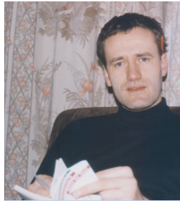
... sowie beim Studium in den 80er Jahren in Frankfurt.

Ich lebte in Offenbach mit meiner Lebenspartnerin, da es damals fast unmöglich war, eine Wohnung für Studenten zu einem auch nur halbwegs akzeptablen Preis in Frankfurt zu bekommen. Positiv daran war, dass ich täglich mit dem Fahrrad zum Uniklinikum fahren konnte.